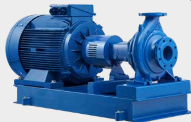
End Suction Norm Pumper DanPumps S-ELP (DN 150 - DN 250 mm)