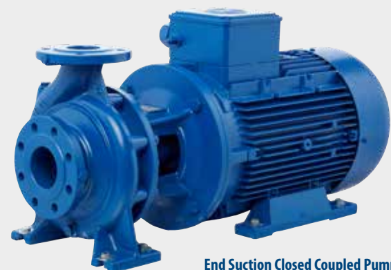
End Suction Closed Coupled Pumper DanPumps S-ECP (DN 32 - DN 150 mm)