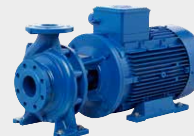
End Suction industri-/marinepumper