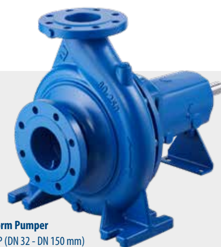
End Suction Norm Pumper DanPumps S-ENP (DN 32 - DN 150 mm)