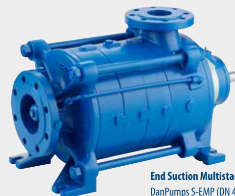
End Suction Multistage Pumper DanPumps S-EMP (DN 40 - DN 150 mm)